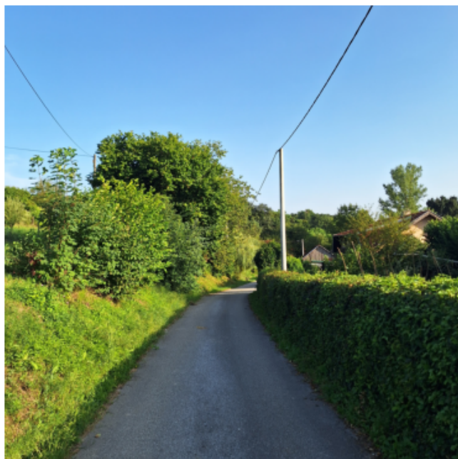
Slika 6.1: Originalna slika

Primjer korištenja SVD dekompozicije matrice na kompresiji slike u boji vidimo na sljedećim slikama: