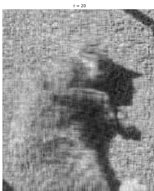
Slika 5.2: Rang r=20