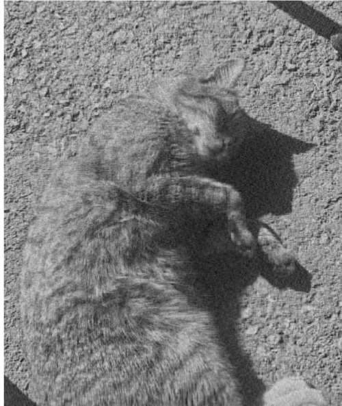
Slika 5.3: Rang r=100