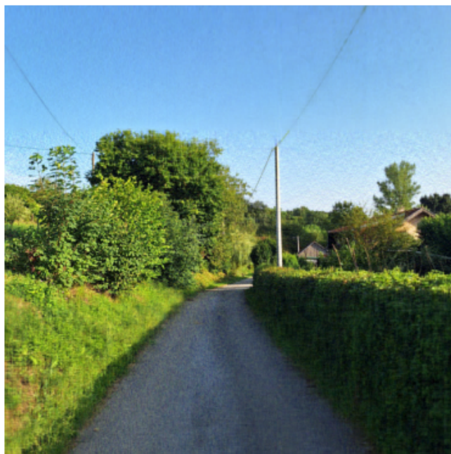
Slika 6.4: Rang r=100