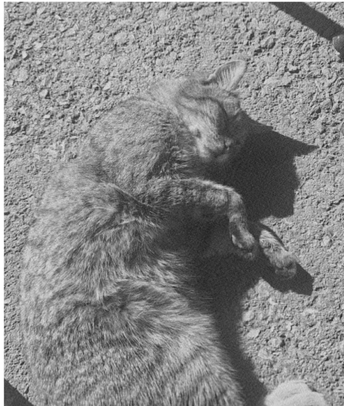
Slika 5.4: Rang r=200