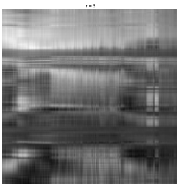
Slika 4.2: Rang k = 5