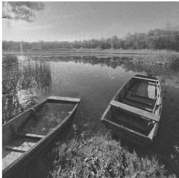
Slika 4.4: Rang k = 100