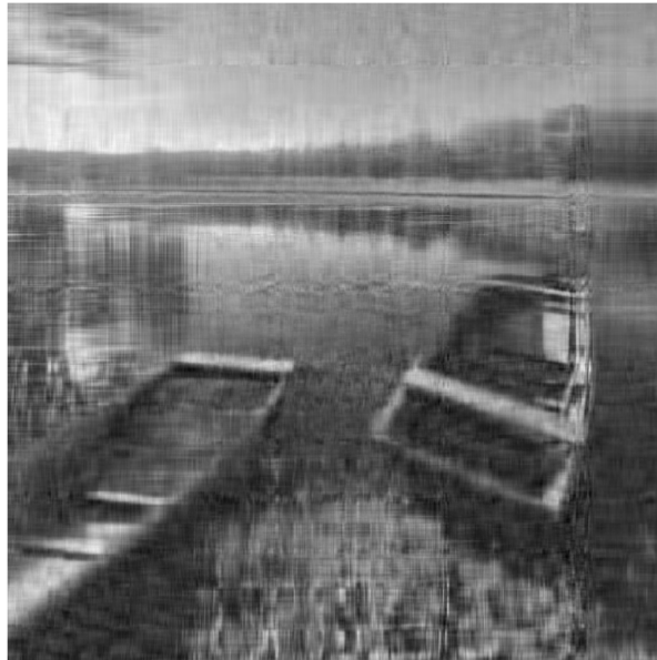
Slika 4.3: Rang k = 20