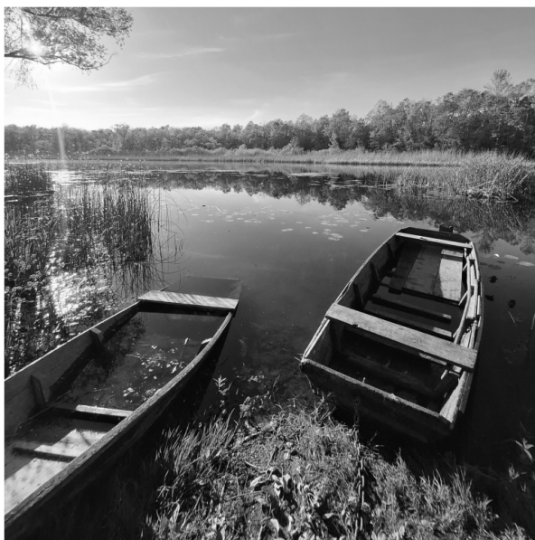
Slika 4.1: Originalna slika.