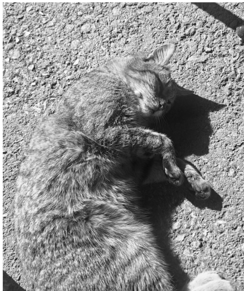
Slika 5.1: Originalna slika

Još jedan primjer korištenja gore objašnjene implementacije na grayscale slici 5.1 vidimo u prilogu :